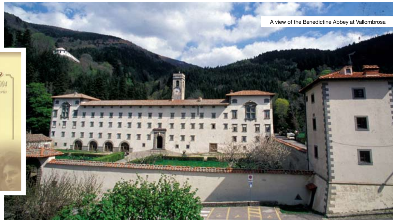
A view of the Benedictine Abbey at Vallombrosa