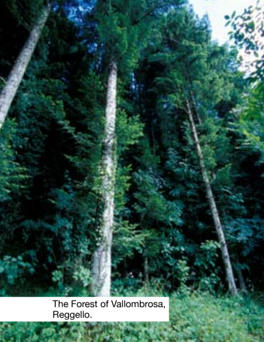
The Forest of Vallombrosa, Reggello.